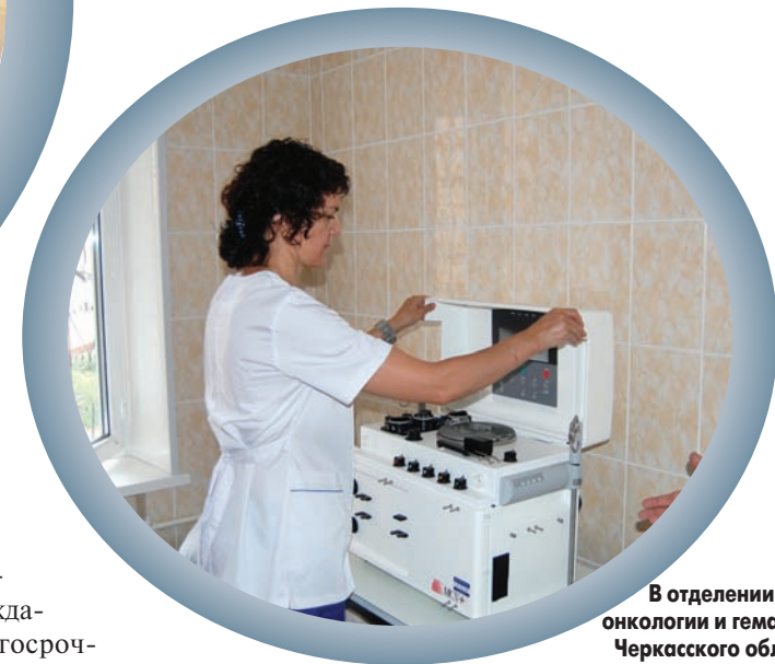
В отделении детской онкологии и гематологии Черкасского областного онкодиспансера установлен современный аппарат для плазмафереза

длительные курсы химиотерапии, и пациентов, не нуждающихся в долгосрочном пребывании в стационаре.