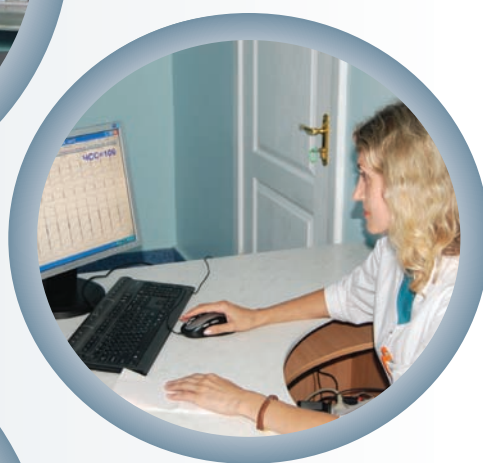
Благодаря установке аппарата «Телекард» врачи районных ЛПУ могут получить консультации у специалистов областного кардиоцентра