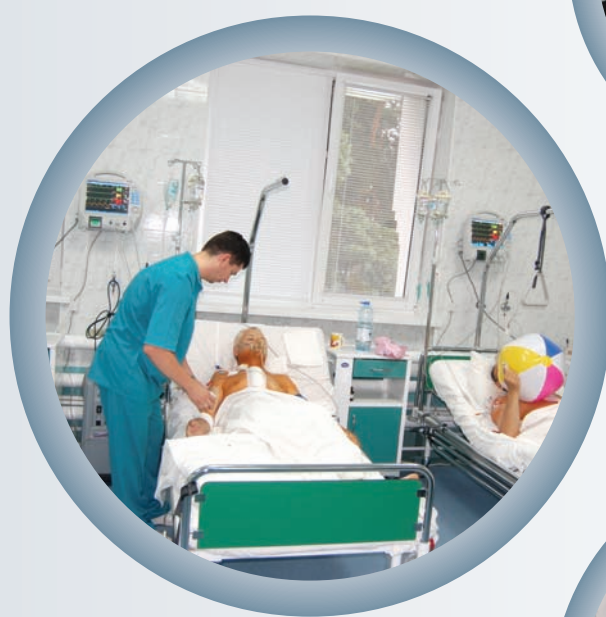
В отделении анестезиологии и интенсивной терапии Черкасского областного кардиоцентра