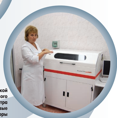
В клиничко-диагностической лаборатории Черкасского областного кардиоцентра установлены новые автоматические анализаторы