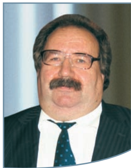
Президент Української асоціації остеопорозу, заслужений діяч науки та техніки України, доктор медичних наук, професор Владислав Володимирович Поворознюк:

Веселих вам новорічних свят та нових вагомих звершень!