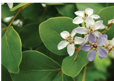
Гваяковое дерево ( Guaiacum officinale )