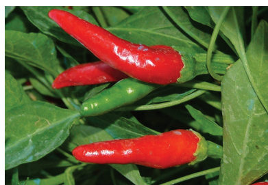
Перец лекарственный ( Capsicum annuum )

Капсаицин – вещество, входящее в состав перца лекарственного, – оказывает болеутоляющее и противовоспалительное воздействие, связываясь с рецепторами ноцицептивных нервных волокон. Первый контакт с капсаицином приводит к выбросу субстанции P – основного медиатора боли. Пациент ощущает покалывание и легкое жжение на языке. При повторном воздействии капсаицина запас субстанции P истощается, в результате чего