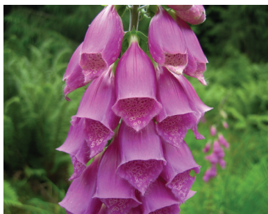
Наперстянка пурпурная ( Digitalis purpurea )