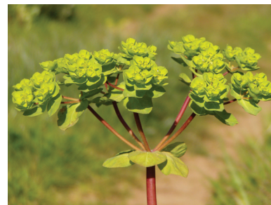
Молочай огородный ( Euphorbia peplus )