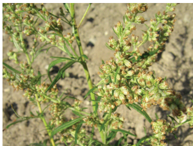
Полынь однолетняя ( Artemisia annua )