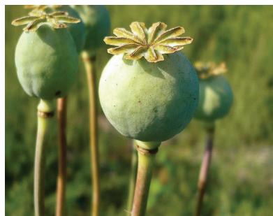
Мак снотворный ( Papaver somniferum )