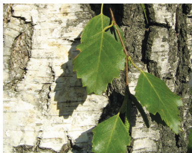
Береза ( Betula pendula )