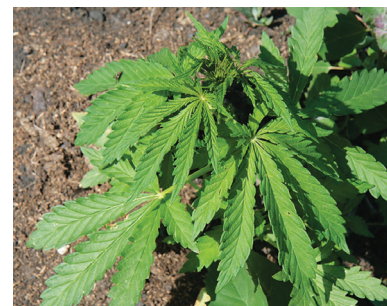
Конопля ( Cannabis sativa )

под его руководством уже давно занимается изучением механизмов апоптоза, а также их изменений в процессе злокачественной трансформации.