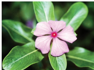
Катарантус розовый ( Catharanthus roseus )