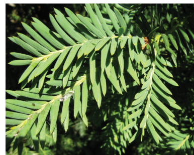
Тис коротколистный ( Taxus brevifolia )

вспомнить появившиеся в последнее время многочисленные сообщения о тяжелых негативных эффектах, вызванных применением хорошо известных субстанций.