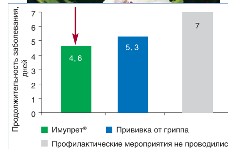
Рис. 2. Средняя продолжительность заболевания в расчете на пациента

тогда как у вакцинированных школьников она составила в среднем 5,3 дня, а в группе пациентов, принимавших фитопрепарат, — 4,6 дня (рис. 2).