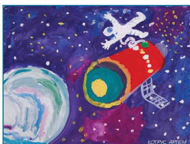
Котрус Артем, м. Запоріжжя, 12 років