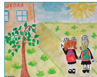
Ерофтьєва Аріна, м. Донецьк, 6 років