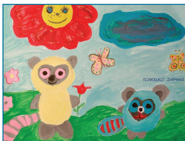
Полюшко Дарина, м. Лисичанськ, 7 років