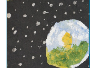
Карпович Софія, м. Житомир, 4 роки