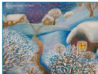
Новосьолова Тетяна, м. Макіївка, 12 років