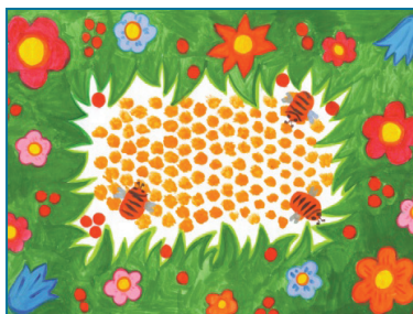
Дмитрієв Степан, м. Донецьк, 7 років