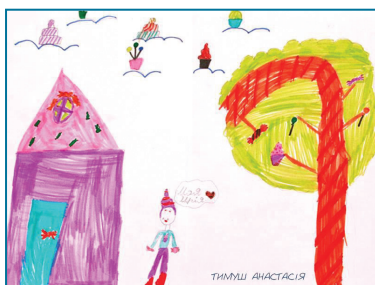
Тимуш Анастасія, м. Чернівці, 7 років