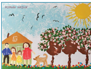
Ропчан Надія, м. Чернівці, 4 роки