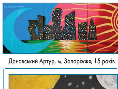
Доновський Артур, м. Запоріжжя, 15 років