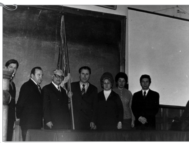
Кафедра факультетської педіатрії отримала «Перехідний Червоний прапор» (1981)