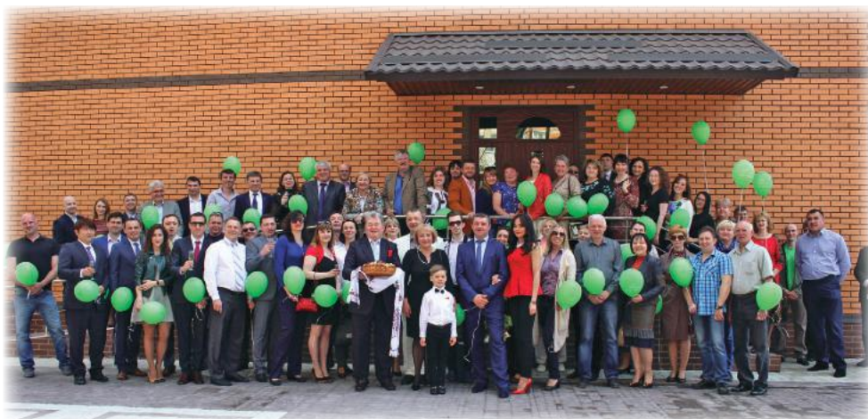
Команда «Фармаско» и гости праздника