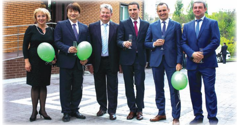
Поздравляют друзья и партнеры

в захватывающее путешествие по лабиринтам истории «Фармаско», слайд-шоу фотографий, на которых были запечатлены яркие моменты из жизни компании, а также примерить на себя роль участника интеллектуальной викторины «Кто хочет стать миллионером?», хорошее настроение и праздничный торт — таким войдет в историю компании этот день.