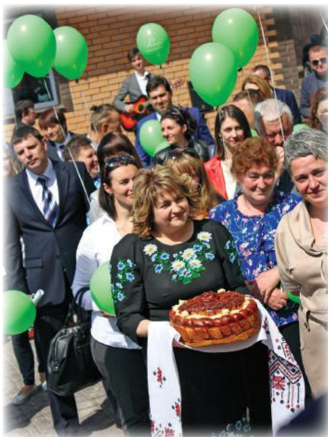
Пусть новый дом «Фармаско» будет наполнен миром, добротой и любовью!