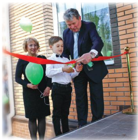
В новый офис – с новыми надеждами!

Согласно принципам фэншуй, выбирая новый дом, мы меняем свою судьбу. Уверена, не является исключением и переезд в новый офис – рабочее пространство, в котором, если верить приблизительным подсчетам ученых, человек проводит около 10 лет (!) своей жизни. Вряд ли кто-то поспорит с тем, что работать лучше, дольше и результативнее (а это напрямую предопределяет производительность труда) нам помогает не только финансовая мотивация, но и «нотки комфорта»: светлые просторные помещения, хорошая звукоизоляция, эргономичная мебель, стильный дизайн интерьера, а также дополнительные «бонусы» в виде удобного местоположения, наличия в пределах пешей доступности любимого кафе или парка с необыкновенно красивыми пейзажами.