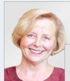
Ruth Bonita Beaglehole

Чи є безпечними та ефективними ці пристрої? Про глобальну пандемію куріння й доцільність застосування СНТ та електронних сигарет у боротьбі з цією шкідливою звичкою ми поспілкувалися з колишніми експертами ВООЗ у сфері боротьби з тютюном Ruth Bonita Beaglehole та Robert Beaglehole.