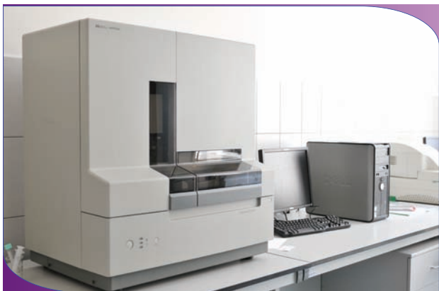
Рис. 1. Генетический анализатор для HLA-типирования доноров

Этапы усложнения диагностики лейкоза – смертельно опасного заболевания крови, которое в отсутствие лечения приводит к летальному исходу в 100% случаев, – выглядят следующим образом: анализ крови – микроскопия – иммуноцитология – цитогенетика – молекулярная диагностика.