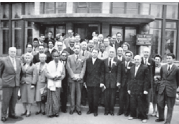
Семинары ВОЗ (июль и октябрь 1965 г.) в Харькове