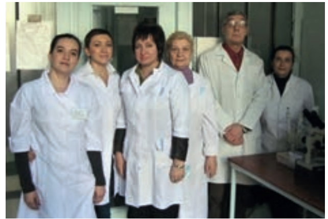
Сотрудники лаборатории микробиологии