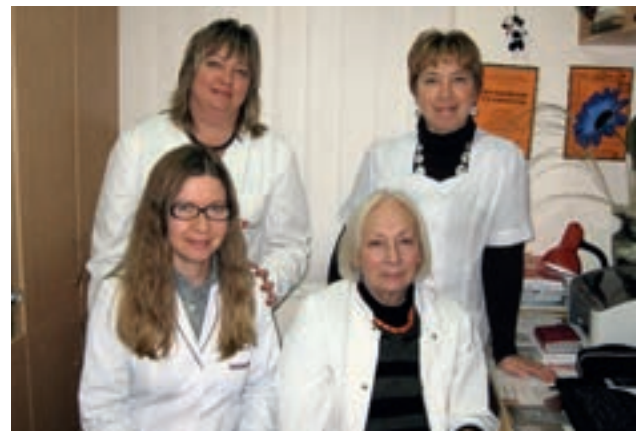
Сотрудники лаборатории аллергологии