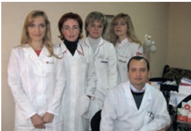
Сотрудники отдела инфекций, передающихся половым путем