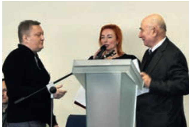
Нагородження почесними грамотами