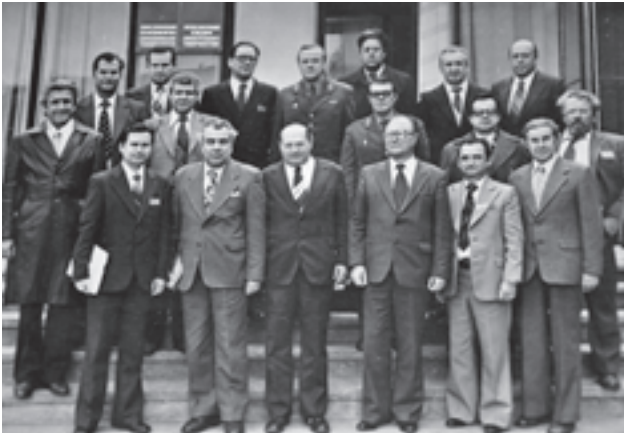
Встреча видных ученых страны (80-е годы)

поколения – урогенитального хламидиоза, микоплазма, уреаплазма, вирусных инфекций, сифилиса и др.