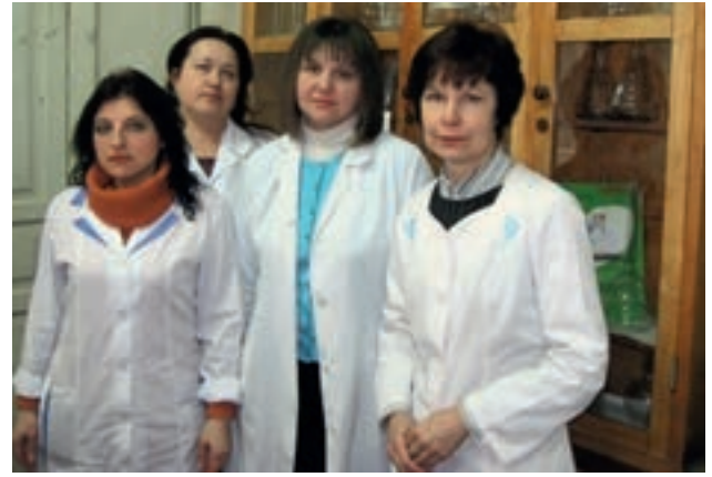
Сотрудники лаборатории биохимии