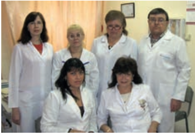
Сотрудники консультативной поликлиники