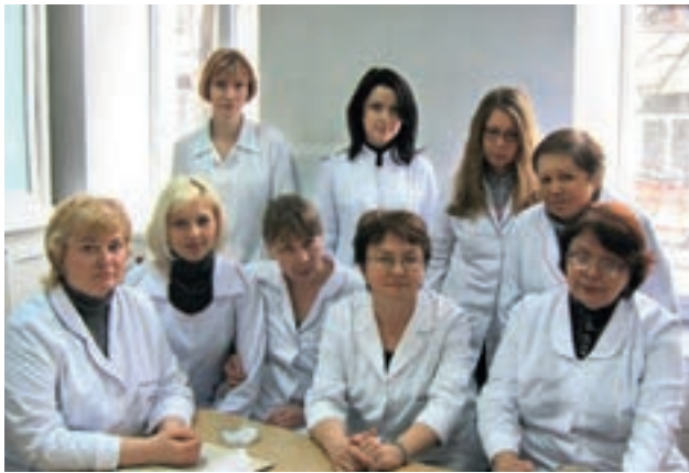
Сотрудники отдела дерматологии, инфекционных и паразитарных заболеваний кожи